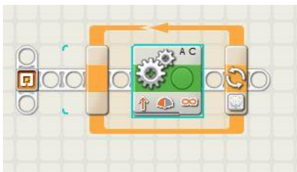
Obrázek 1 program lezení