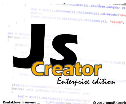
obr. 1 – uvítací rozhraní aplikace