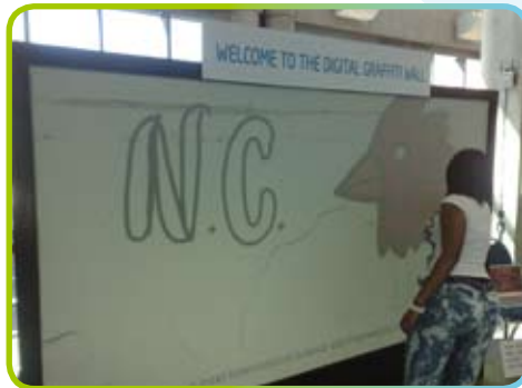
▲ Zábavné graffiti

gratulace a malovali obdivné obrázky na digitální stěny graffiti.