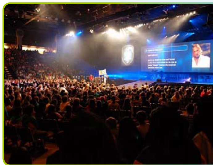
▲ Slavnostní zahájení soutěžní přehlídky Intel ISEF