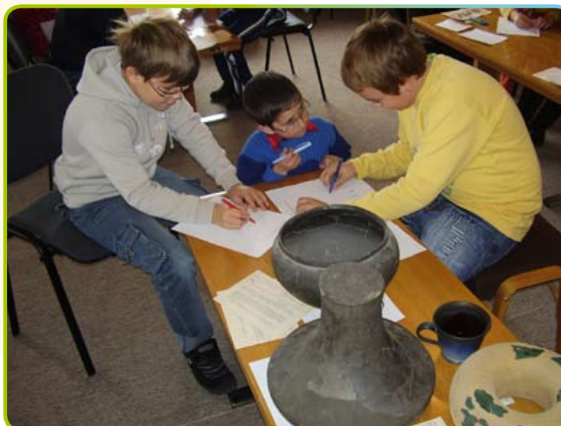
▲ Talenty se nejlépe rozvíjí při odborné práci pod vedením učitelů