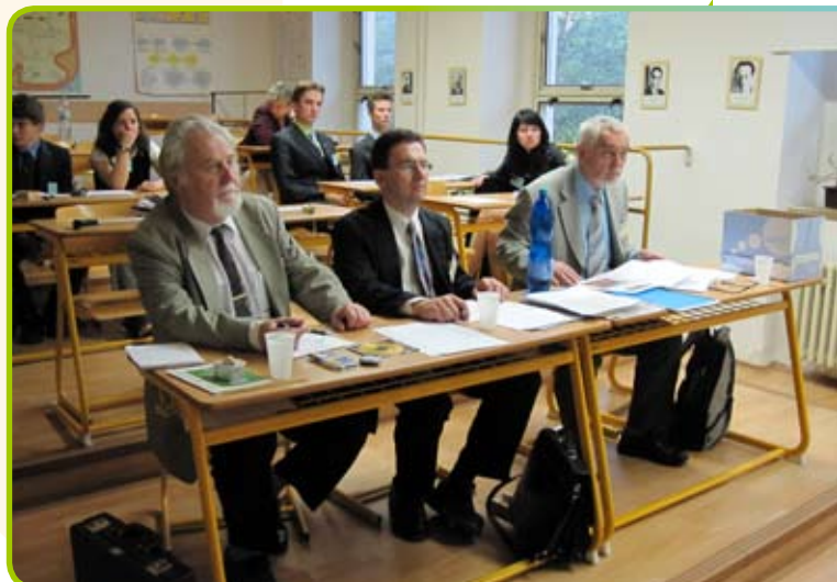
▲ Zasedání komise oboru 09, 10