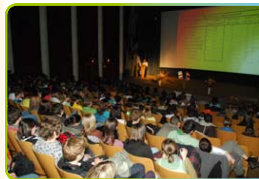
▲ O prezentované práci byl velký zájem

Středa byla věnována vlastní pracovní části setkání. Odeznělo 13 soutěžních prací ve třech odborných sekcích. Humanitní, přírodovědecko-technické a ekologické. Na referátech se podíleli šesti pracemi zahraniční studenti a sedmi pracemi studenti naši. Delegace z Turecka prezentovala dvě práce mimo soutěž.