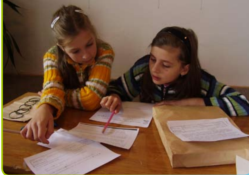
▲ Děti ze základní školy ve Vodňanech pracují na ročníkové práci

Dalo se tedy předpokládat, že tento žák by mohl splňovat předpoklady pro klasifikaci: talentovaný žák v oblasti matematicko-logické a jazykové inteligence. Vzhledem k tomu, že již chodil do 7. třídy, vynechali jsme ověřování jeho nadání a přikročili přímo k ročníkové práci. Abychom ale ověřili jeho schopnost vyrovnat se s problémovými situacemi, zvolili jsme pro něj zdánlivě odtazité