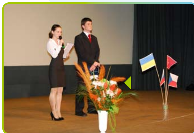
▲ Celou konferencí provázeli dva studenti

Vedení gymnázia v Uničově, spolu se všemi spolupracovníky, kteří se na zdárném průběhu konference podíleli, věří, že položili základ nové tradici setkávání talentovaných studentů z Evropy.