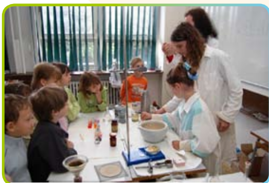
▲ Prezentace chemických pokusů pro ZŠ

Ročně různé akce ústavu navštíví více než 500 středoškolských studentů, z nichž ca 5 % po té s ústavem spolupracuje na dalším svém aktivním zapojení do vědy a výzkumu (stáže, odborné školní a prázdninové praxe apod.). Středoškolská studenta, kteří v ústavu v letech 2005-2009 absolvovali svou středoškolskou stáž, po maturitě pokračovali vysokoškolským studiem přírodovědného či technického typu. Téměř všichni, kteří v období 2005-2009 spolupracovali s vědci z ÚFCHJH se do ústavu vrací jako vysokoškolská studenta. Studují převážně PŘF UK či VŠCHT v Praze, Univerzitu Pardubice, ČVUT v Praze. Příklad hovořící za vše – v zahájeném školním roce 2009/2010 se téměř třetina vysokoškolských stážistů (bakaláři a magistři), kteří ústav navštěvují v celkovém počtu ca 30 studentů, rekrutovala z našich středoškolských, kteří s ústavem již dříve 1 až 3 roky spolupracovali.