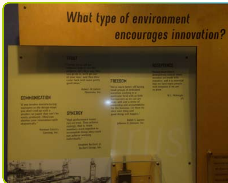
▲ V muzeu v San Jose proběhlo zahájení městského kola soutěže