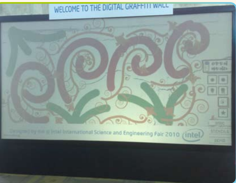
▲ Také máte chuť vytvořit něco nového?

A tak, když jako správní učitelé přijdeme do školy a vidíme správného studenta, nápady v mozku začnou proudit. Vezmeme studenta a pomyslně s ním na stěnu kreslíme pěkné projektové graffiti. S příslušným počtem kreditů je proud nápadů dostatečně silný.