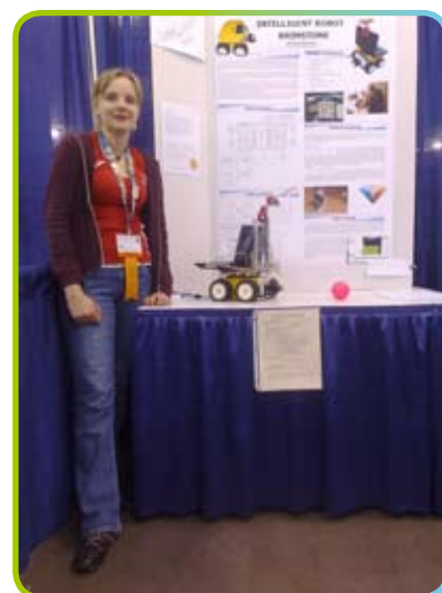
▲ Inteligentní robot Žlutásek