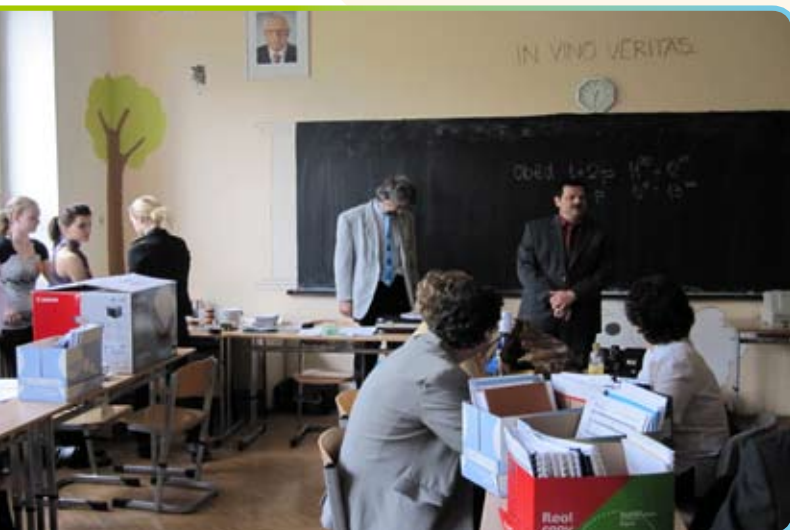
▲ Slavnostní zahájení krajského kola SOČ

Na druhé straně je potěšující skutečností, že přes všechny problémy si olomoucký kraj v celostátním měřítku vede docela dobře. Podívejme se, jak je na tom kraj s „medailovými“ místy. Tedy prvními až třetími cenami. Za posledních pět let bylo uděleno celkem 261 cen to je 100 % (3 roky v 17 a 2 roky v 18 oborech). Olomoucký kraj získal 19 cen, což je 7% úspěšnost a řadí se tak spolu s krajem Zlínským a Moravskoslezským na slušné páté místo.