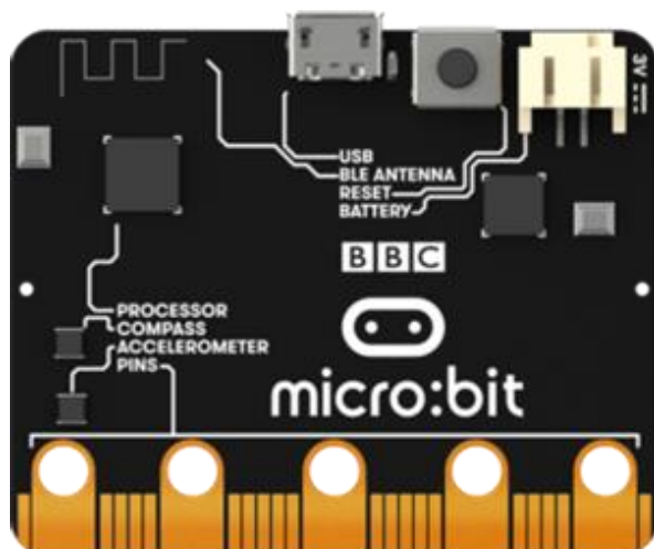
Deska BBC Micro:bit